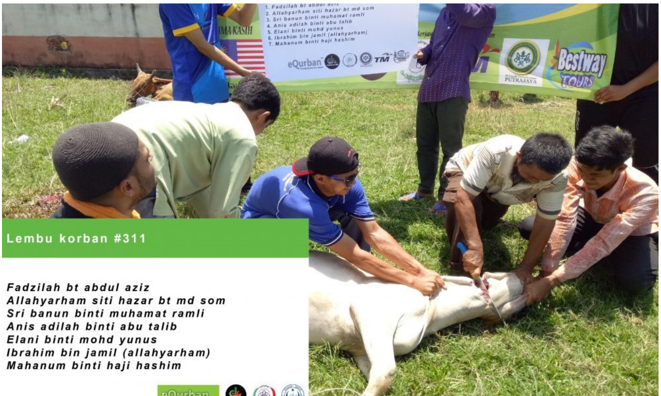
Lembu korban #311