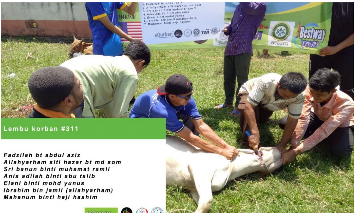
Lembu korban #311