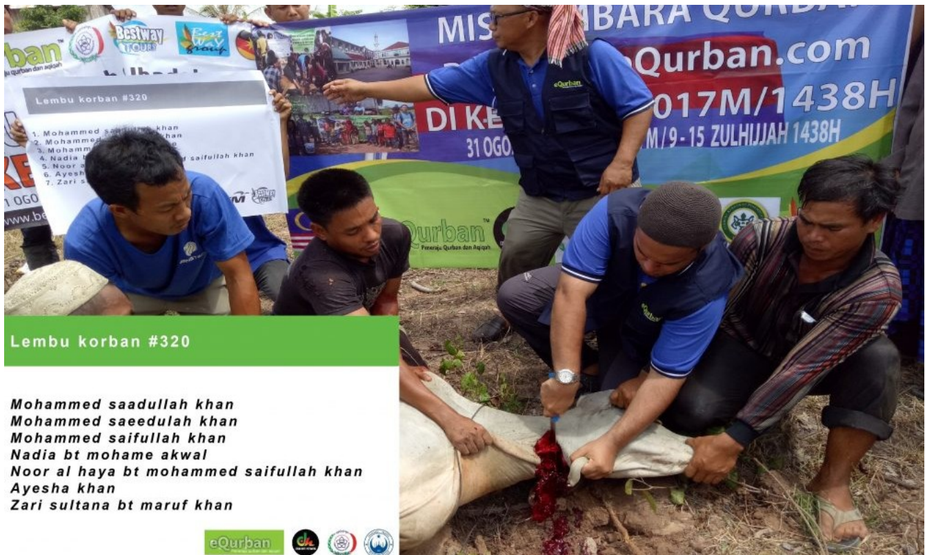
Lembu korban #320