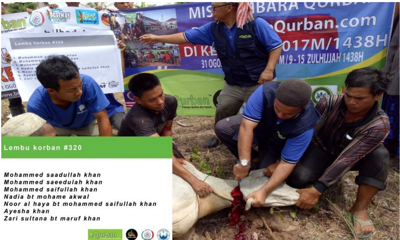
Lembu korban #320